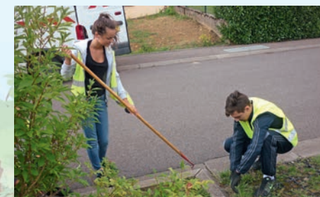
Les jeunes en action

Durant les vacances scolaires, la commune a accueilli 35 jeunes vitryens en job d'été. L'occasion pour eux de découvrir pour la plupart le monde du travail et ses exigences, de donner un bon coup de main aux services techniques de la commune et enfin chose non négligeable, de se faire un petit pécule.