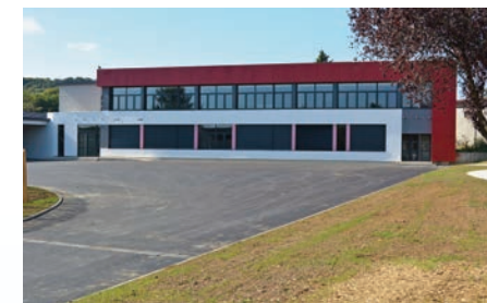
Le nouveau bâtiment périscolaire a fière allure !

Bonne rentrée à toutes et à tous et bonne lecture.