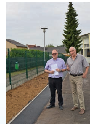
Le Maire en compagnie du Directeur Général des Services constate l'achèvement des travaux quelques jours avant la rentrée

La commune a profité des vacances pour aménager dans la cour de l'école maternelle le long de la clôture grillagée une bande de terre destinée à accueillir une haie arbustive. En plus des vertus écologiques de cette haie, elle proposera à terme une barrière naturelle au soleil et protégera efficacement les enfants. Les plantations d'arbres paillisants et d'arbustes aura lieu cet automne.